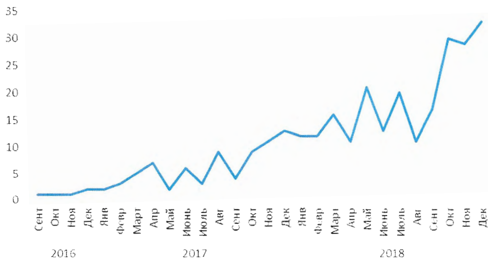
Число реализованных программ